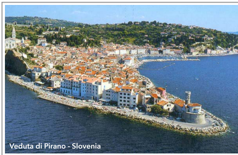
Veduta di Pirano - Slovenia