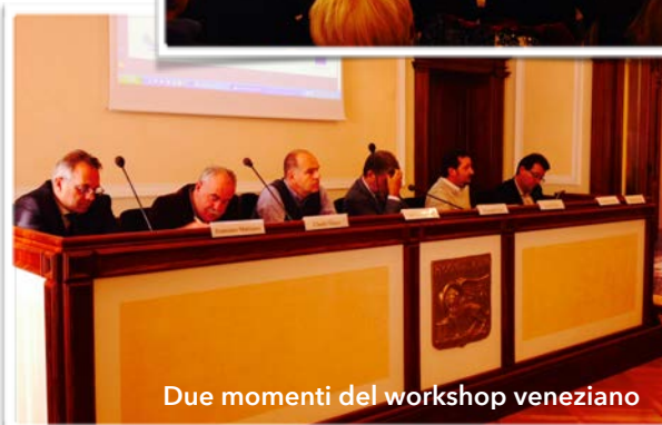
Due momenti del workshop veneziano

territoriale organizzato dalla Regione del Veneto, dal titolo " Le fortezze in Veneto tra pubblico e privato. Come una gestione innovativa delle architetture militari può contribuire allo sviluppo locale ". L'incontro ha riunito alcune realtà regionali impegnate nella valorizzazione del territorio fortificato veneto per un confronto sulle potenzialità future del